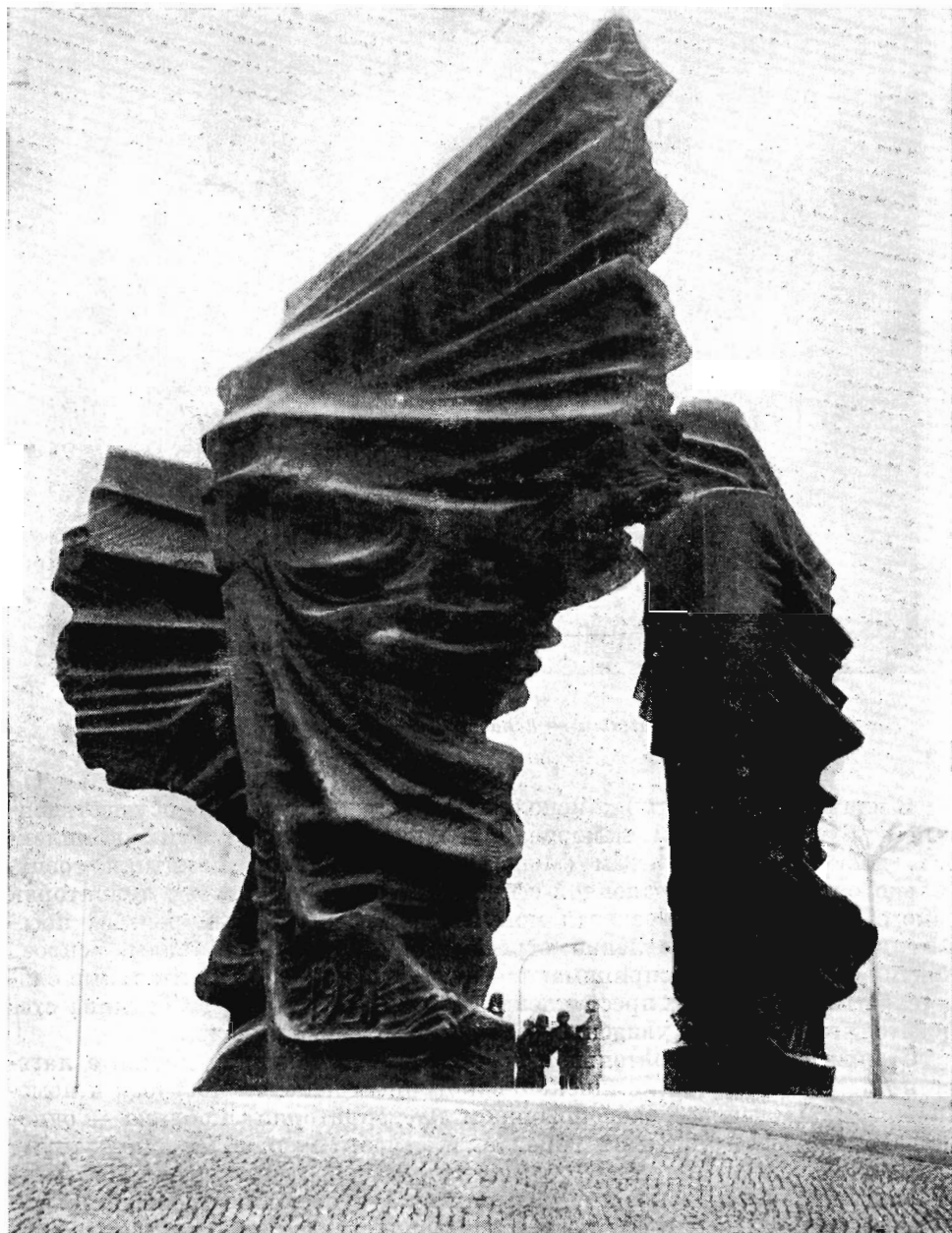
Г. Земла. Памятник сilesким повстанцам в Катовицах. 1967 г.

Можно говорить о некоторой переусложненности подходов к основному памятнику. Чтобы подняться к нему, нужно вначале пройти в небольшие ворота к вечному огню, затем по углублению, выложенному крупными камнями. Это по-своему интересное обыгрывание фактуры и конфигурации каменных глыб, однако оно воспринимается, по отношению к властвующей над огромным пространством бетонной глыбе, как излишняя подробность.