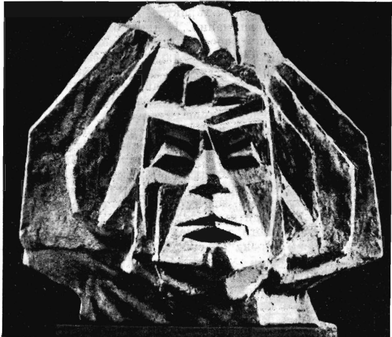
З. Пронашко. Голова Мицкевича, 1926 г.