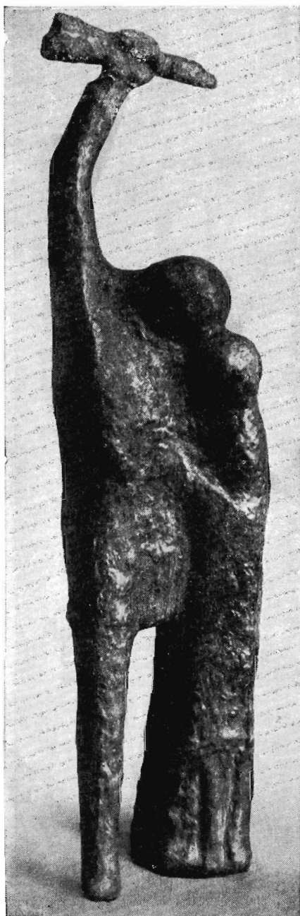
А. Процки. Модель памятника павшим в годы второй мировой войны в Пулавах. 1963 г.

В работе Мариана Конечного можно проследить несколько линий. Восприятие времени соотносено здесь с различными традициями. Массивная, распластанная на постаменте и вместе с тем словно летящая вперед фигура имеет родство не только с мотивами античности. В ней с полной силой проявляет себя одна из особенностей романтизма с его интересом к необычному, стремлением к олицетворению стихийных сил. В мощном движении масс, экспрессивном жесте вытянутой вверх руки, благодаря острому соотношению горизонтали фигуры, силуэта развивающихся волос и занесенного над головой меча, возникает пластическое решение, проникнутое мыслью о борьбе, о неодолимом движении вперед. Силуэт фигуры, при всей своей барочности, в наиболее выигрышных аспектах по-современному ясен. Правда, скульптор не вполне последователен, в отдельных зрительных планах недостает пластической проработки, чувствуется тяжеловесность.