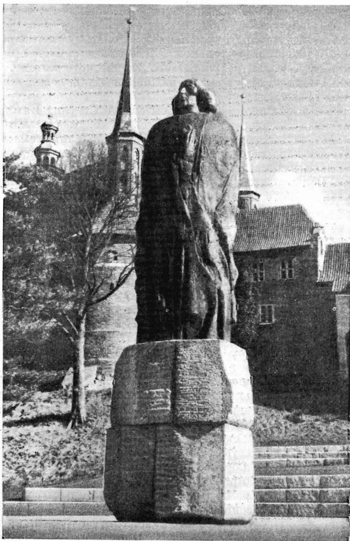
М. Вельтер. Памятник Копернику в Торуне. 1973 г.

Эти романтические интонации появляются и в некоторых других произведениях Вельтера. Но чаще его путь к портретному монументу связан не с романтической символикой, а с отражением живых наблюдений, реалистическим познанием характеров. Много значит для Вельтера опыт станкового искусства. Создавая тот или иной памятник, он уделяет исключительное внимание работе над портретом. В нескольких его вариантах фиксируются стадии познания жизненного материала. Затем, когда один из портретов выбран за основу, начинается обогащение темы.