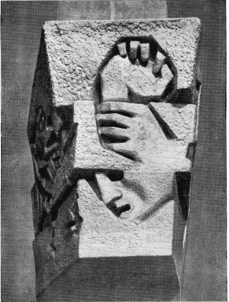
Т. Лодзяна. Памятник жертвам фашизма в Радогоще. 1961 г.

Прежде всего о самом символе. Изображение женщин с мечом вошло в круг мотивов польского искусства. Оно стало эмблемой Варшавы. С этим городом у Мариана Конечного более всего ассоциируется тема борьбы. Все дальше отделившись по существу от эмблематики городского герба, скульптор пытался придать монументальному образу широту, напор, драматический пафос и силу непреклонного жизнеутверждения.