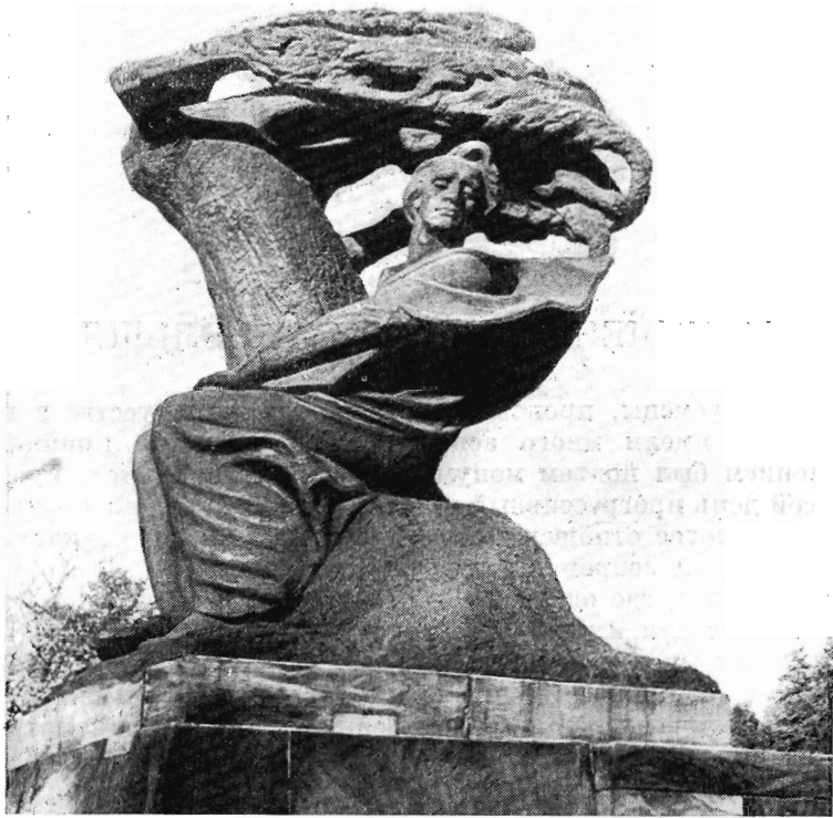
В. Шимановский. Памятник Шопену в Лазенках. Восстановлен в 1958 г.