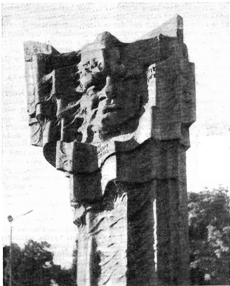
Г. Земла. Памятник В. Броневскому в Плоцке. 1971 г.

Зритель постепенно открывает новые и новые аспекты образного воздействия памятника. Справа, когда памятник смотрится на фоне торца высокого жилого дома, четко рисуются два крыла, сверху проработанных в духе современных индустриальных ритмов, внизу же превращенных в складки знамени. Черный силуэт скульптуры напряженно звучит на фоне белого здания.