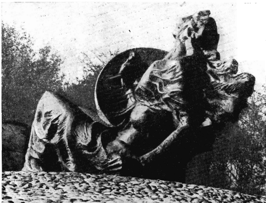
Г. Земла. «Погибли — непобежденные». Варшава, 1973 г.

В планировке памятника использован принцип, впервые осуществленный в Бухенвальдском мемориале, а впоследствии в других комплексах, посвященных жертвам фашизма. Скульптурный памятник сознательно отделен от сохраненной с предельной достоверностью территории самого концлагеря. Обозревая монументальный бетонный рельеф, посетитель получает впечатление огромной эмоциональной силы, сквозь призму которого и воспринимаются в дальнейшем документальные свидетельства фашистских преступлений. Бетонная скульптура Толкина становится обобщением увиденного, незабываемым символом.